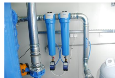
Rurociąg z filtrami