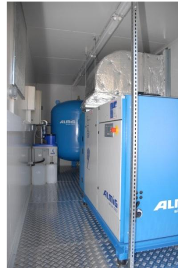
Kontener 20 stopowy z zabudowaną sprężarką Belt 75 Belt 38 w 20 stopowym kontenerze