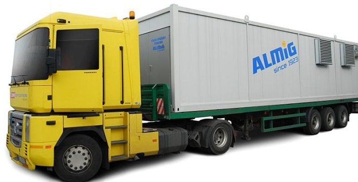
Belt 132 z osuszaczem w 40 stopowym kontenerze